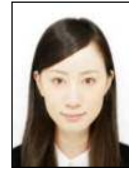
明るすぎる Too bright