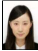
ぼやけている Not clear