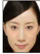
顔が大きすぎる Too big