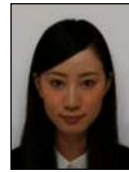
暗すぎる Too dark